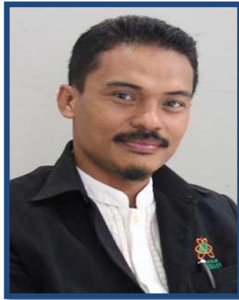
Mas Aman Uppi